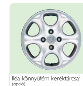
Iléa könnyűfém keréktárcsa 2 (opció)