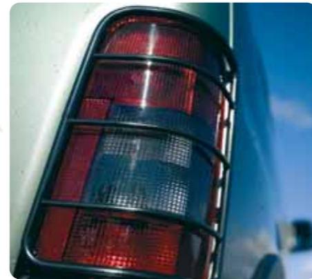
Védőrács a hátsó lámpákon