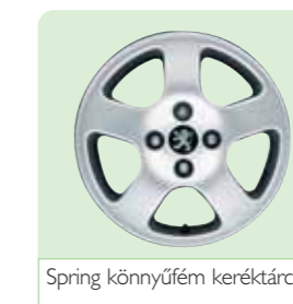
Spring könnyűfém keréktárcsa 3