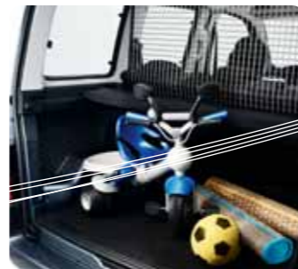
Tágas, csomagterhálóval** elválasztott csomagtartó