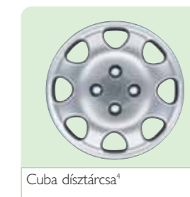
Cuba díztárcsa 4