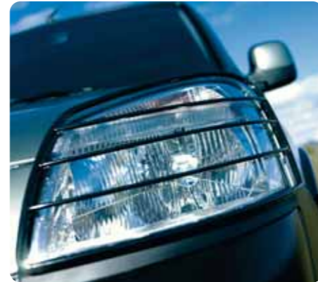
Védőrács a fényszórókon

A 624 dm 3 -es csomagtartó mérete a hátsó ülések lehajtásával akár 2800 dm 3 -re is növelhető.