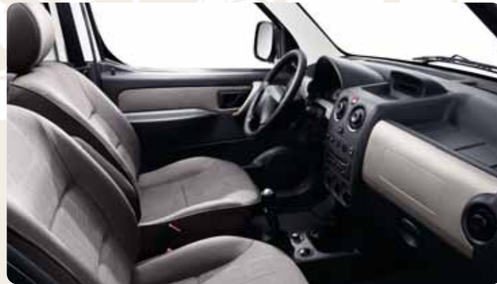
Cédrus belső hangulat