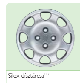
Silex díztárcsa 1+2