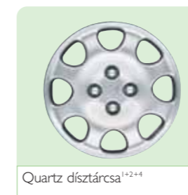
Quartz díztárcsa 1+2+4