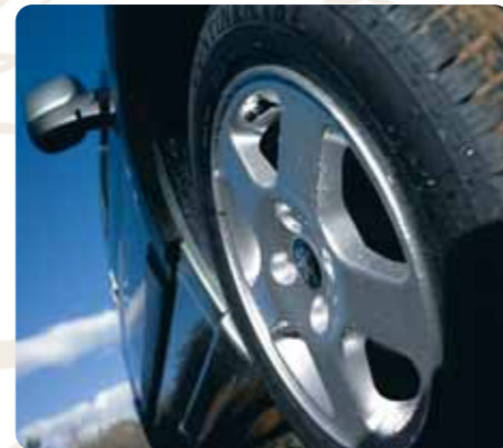
Spring könnyűfém keréktárcsa

Kényelem: ergonomikus műszerfal, könyöktámasz elöl, kétoldali tolóajtó, 2/3-1/3 arányban dönthető hátsó ülés, központi zár távirányítóval, elektromos ablakemelő, utasoldalon elektromos és fűtött visszapillantó tükrök.