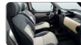
„Totem” speciális kárpit