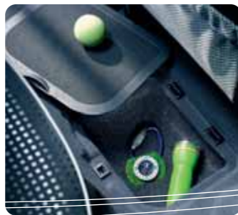
Két rakodórekesz hátul! a padlóban