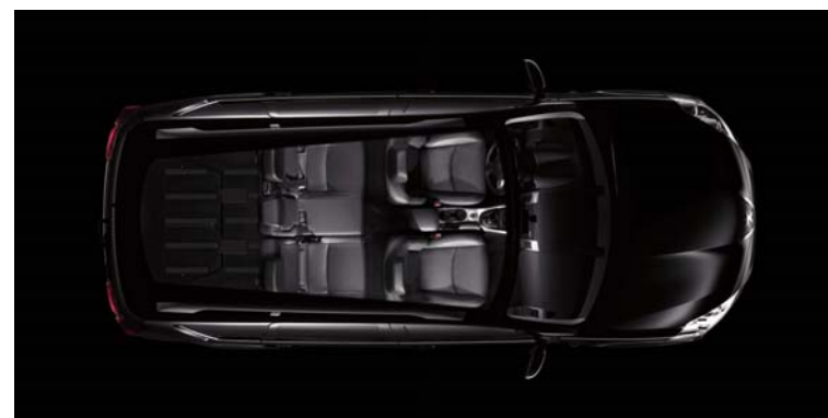
5 üléses konfiguráció

A csomagteremben elhelyezett lehajtható üléseknek köszönhetően 7 személy is kényelmesen utazhat a 4007 fedélzetén.