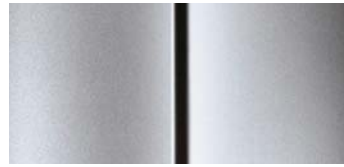
Szürke Cool Silver