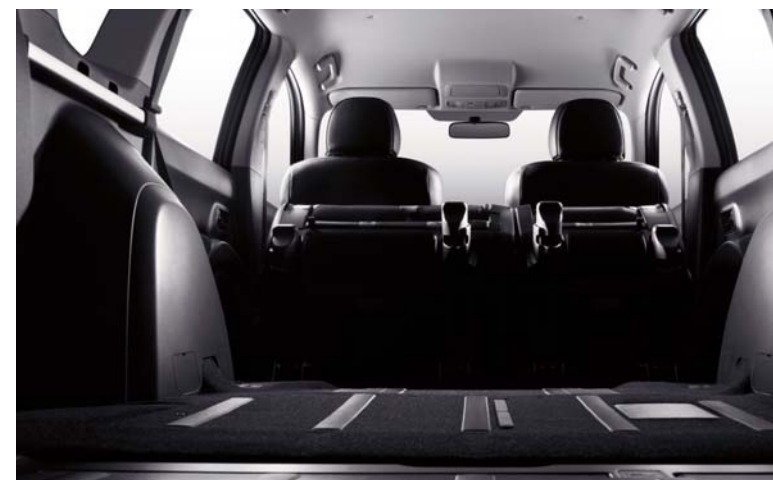
A hátsó lehajtható csomagterajtó könnyed hozzáférést biztosít a csomagterhez.

A 4007 csomagterének ürtartalma 441 litertől, a hátsó ülések lehajtásával akár 1 686 literig terjedhet (VDA szabvány szerint).