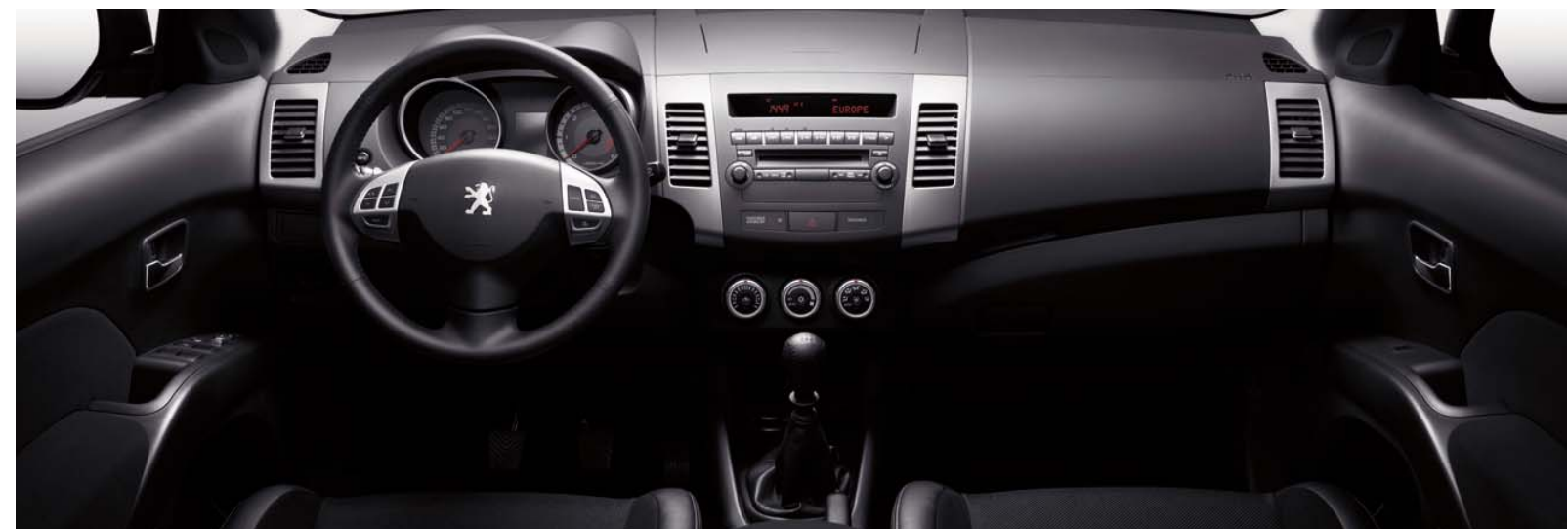
Premium felszereltségi szint belső tere

2225 Üllő, Pesti út 203. Telefon: 06-29/521-150