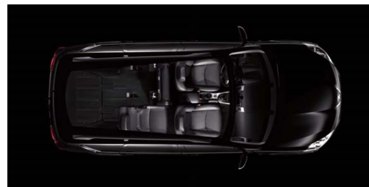
3 üléses elrendezés