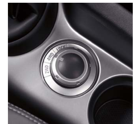
Üzemmod választó kapcsoló

Hó, homok, latyak, sár, vagyis nehezebb körülmények között válassza az összkerek-meghajtást (4WD LOCK): a rendszer a hátsó kerekekre másfélszer nagyobb nyomatékot biztosít, mint normál üzemmódban, így alacsony sebesség mellett is segít leküzdeni a nehézségeket.