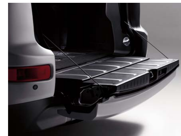
A hátsó lehajtható csomagterajtó könnyed hozzáférést biztosít a csomagterhez.