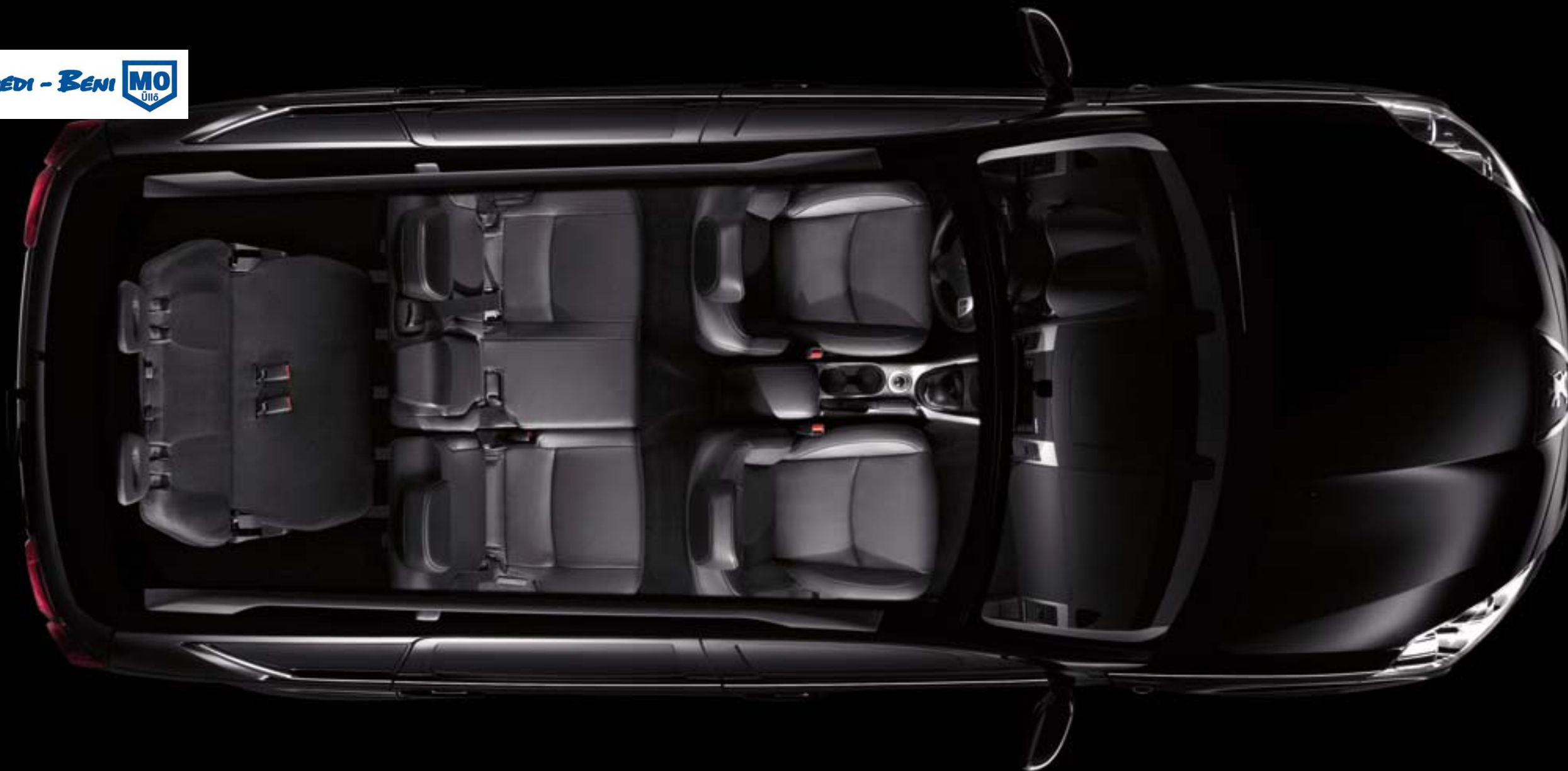
7 üléses elrendezés