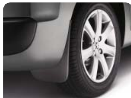
Elegáns hátsó sárfogó