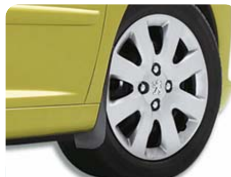
Elegáns első sárfogó