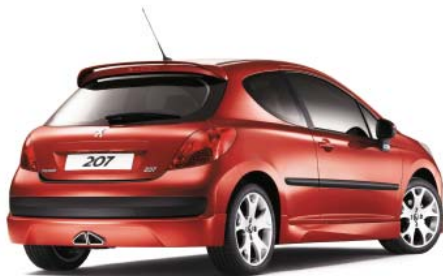
Spoiler és Eveamys könnyűfém keréktárcsa