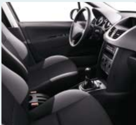
Fekete/sötétszürke Pachinko szövetkárpit. Sötétszürke műszerfal, szürke Lion felső műszerfaldíszítés, Titán hangulat