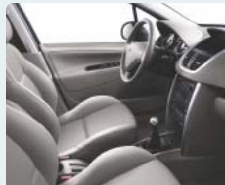
Hamuszürke bőr/perforált bőrkárpit. Sötétszürke műszerfal, Elefántcsont hangulat