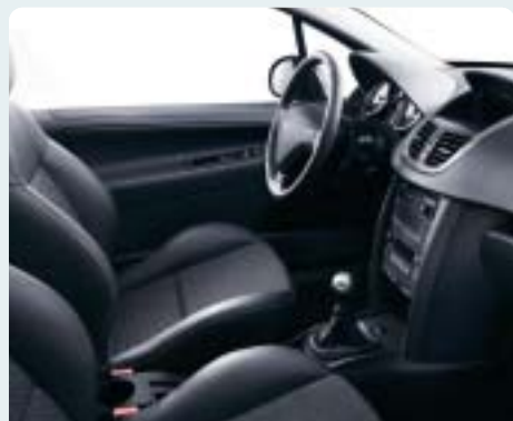
Fekete Adex bőr/szövet kárpit. Fekete műszerfal, Gordon műszerfal- és középkonzol-díszítés, Titán hangulat