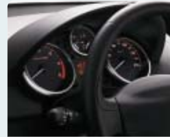
Műszerszámlap Elefántcsont és Gyémánt hangulatokhoz