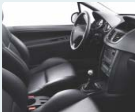
Fekete Mistral bőr/perforált bőrkárpit. Fekete műszerfal, Titán hangulat