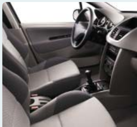
Hamuszürke/sötétszürke Pachinko szövetkárpit. Sötétszürke műszerfal, szürke Lion felső műszerfaldíszítés, Elefántcsont hangulat