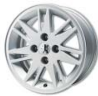
Race 15" könnyűfém keréktárcsa