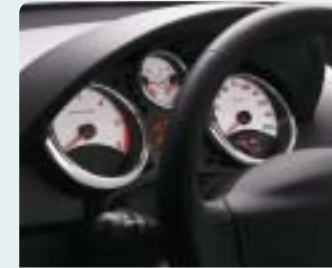
Fehér műszerszámlap krómkerettel Titán hangulathoz