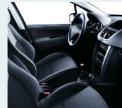
Sötétszürke Chirongui szövet/velúr kárpit. Fekete műszerfal, Ondine műszerfal- és középkonzol-díszítés, Gyémánt hangulat. Csak berline változatokhoz