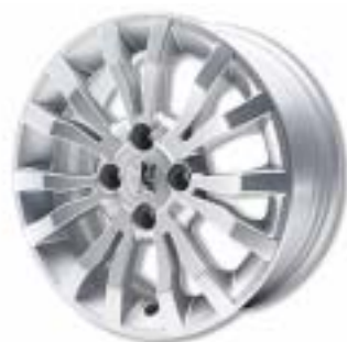
Chrono 16" könnyűfém keréktárcsa