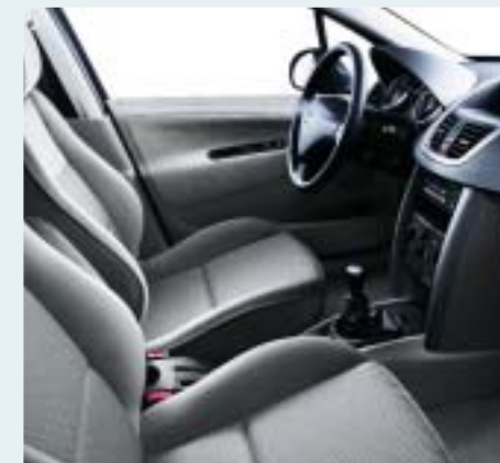
Hamuszürke Chirongui szövet/velúr kárpit. Fekete műszerfal, Ondine műszerfal- és középkonzol-díszítés, Elefántcsont hangulat. Csak berline változatokhoz