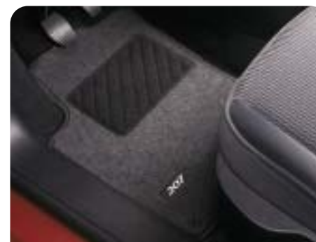
Thin antracit szürke szőnyegszett