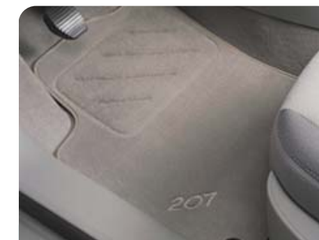
Classic hamuszürke szőnyegszett