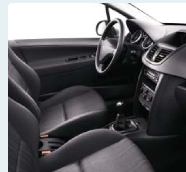
Szürke Koulikoro szövetkárpit. Fekete műszerfal, Titán hangulat