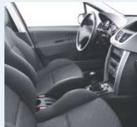
Fekete/szürke Zindal szövet. Fekete műszerfal, Jules műszerfal- és középkonzol-díszítés, Titán hangulat