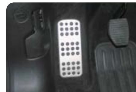
Alumínium lábpihentető díszburkolat