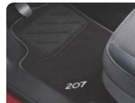
Classic sötétszürke szőnyegszett