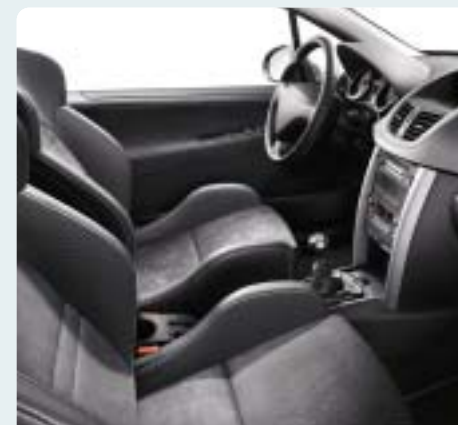
Sportülések Alcantara kárpittal