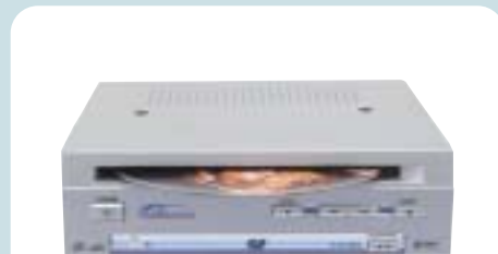
Takara hordozható DVD