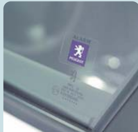
Rádióvezérlésű behatolásátló riasztó