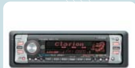
Clarion DXZ 848 rádió-CD, MP3-lejátszóval